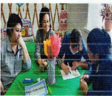
Нравится glyshkonadezda и другим zharsai_negizgi_mektebi "Бары да, ана, бір нәзінен басталды!" тақырыбында 1-9 сыныптарда ата-аналар жиналысы өтті