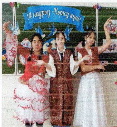
zharsai_negizgi_mektebi Бүгін, 14 наурыз – Көрісу күні. Бұл күнді Аман мерекесі деп те атайды. Адамдар осы күні... еше